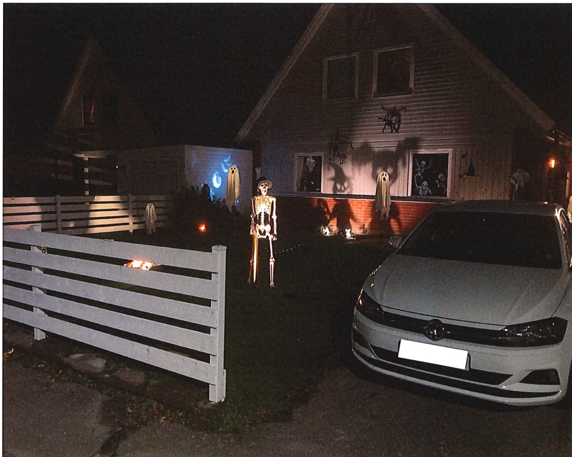
Halloween på Fårhjordsvägen 2025. Men nu går vi mot ljusare tider...